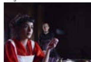
Räuberinnen: Schiller mal ganz anders