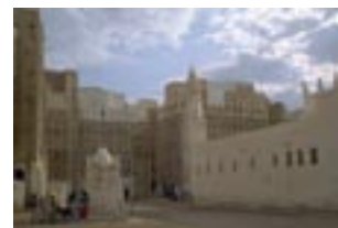
Superland: Ein irakisches Dorf wird nachgebaut

Ein einfaches Fischer mädchen gerät im 17. Jahrhundert in die kriegerischen Wirren zwischen den Städten Zürich und Rapperswil. Als ihr Vater von der Obrigkeit brutal umgebracht wird, schliesst sie sich einer Frauenbande an, welche als Piratinnen entscheidend in den Konflikt der beiden Städte eingreift.