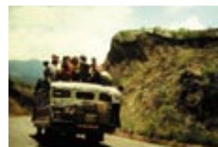
Ya! Reise durch Latein America