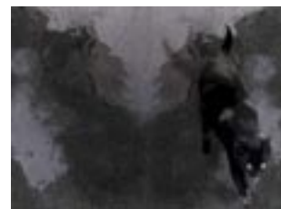
Tiere: Ein thriller in der Schweiz

Walter Bosshard: Der erste Mann, der Mao in den Dreissigern fotografierte. Der Schweizer Fotograf und Journalist ist auf der Suche nach Liebe, persönlicher Erfüllung und Abenteuern in China. Doch nach mehreren Jahren spannender Ereignissen, Abenteuern und Begegnungen, muss er mit leeren Händen weiterziehen.