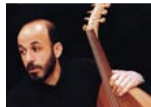
Ya Sharr Mout Arabisch-Schweizerische Zwischentöne