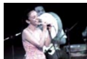
Musical Oasis: Swinging Kairo