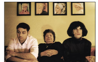
La Fidanzata: Unerwarteter Besuch