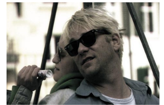
Strähl: Traum vom grossen Fang