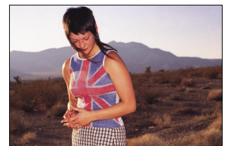
Skinhead Attitude: Ein Roadmovie